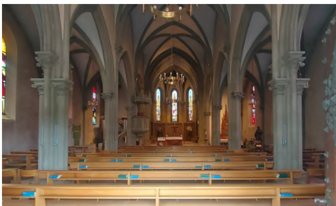
Aktuelle Situation / Situation actuelle