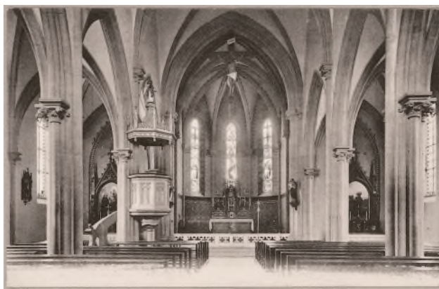
Bild von 1926 / Image de 1926